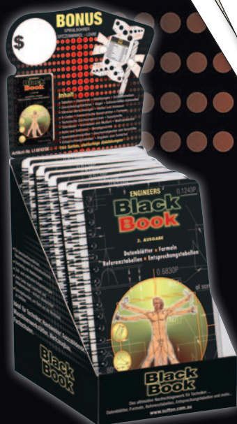
Verkaufsstand (Bücher werden getrennt verkauft)

Eine Fülle an aktuellen, nützlichen Informationen auf über 160 matt laminierten, fettunempfindlichen Seiten. Liegt dank Spiralbindung beim Lesen flach auf der Werkbank und ist ideal für Ingenieure, Handwerker, Werkstätten, Werkzeughersteller und Fachschulen.